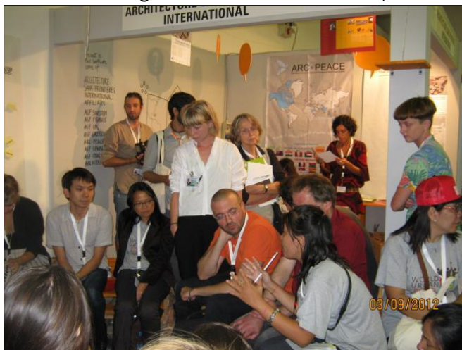
Stand d'ASF-Int au Forum urbain mondial à Naples, Septembre 2012

Afin de financer la participation d'ASF-Int, un bon de souscription spécial a été élaboré par ARC●PEACE et affiché sur les sites Web d'ASF-Int et ARC●PEACE. Toutes les organisations membres ont été invitées à contribuer aux coûts (principalement le coût du stand loué). Le résultat a été que le coût total de € 1630 devrait être partagé à peu près également entre les dix membres.